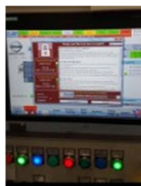
工場内の制御端末